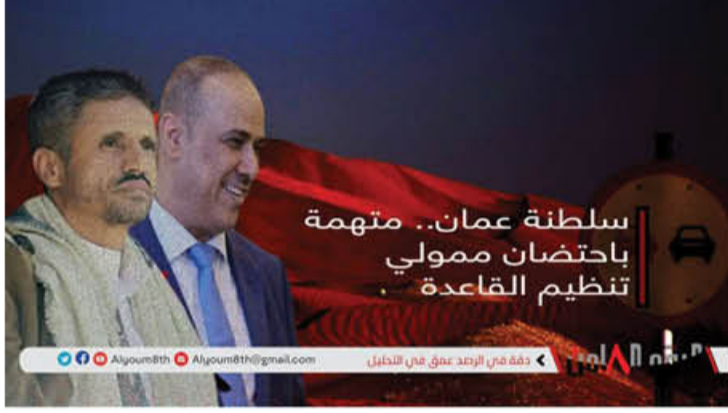
سلطنة عمان.. متهمه باحتضان ممولي تنظيم القاعدة

وقال أن المواجهة ضد هذا التنظيم ومن يموله كبيرة جداً.. معتبرا ان مواجهة الجنوبيين للإرهاب تاريخية.. محذرا من مغبة ترك الجنوب دون مساندة في مواجهة الإرهاب».